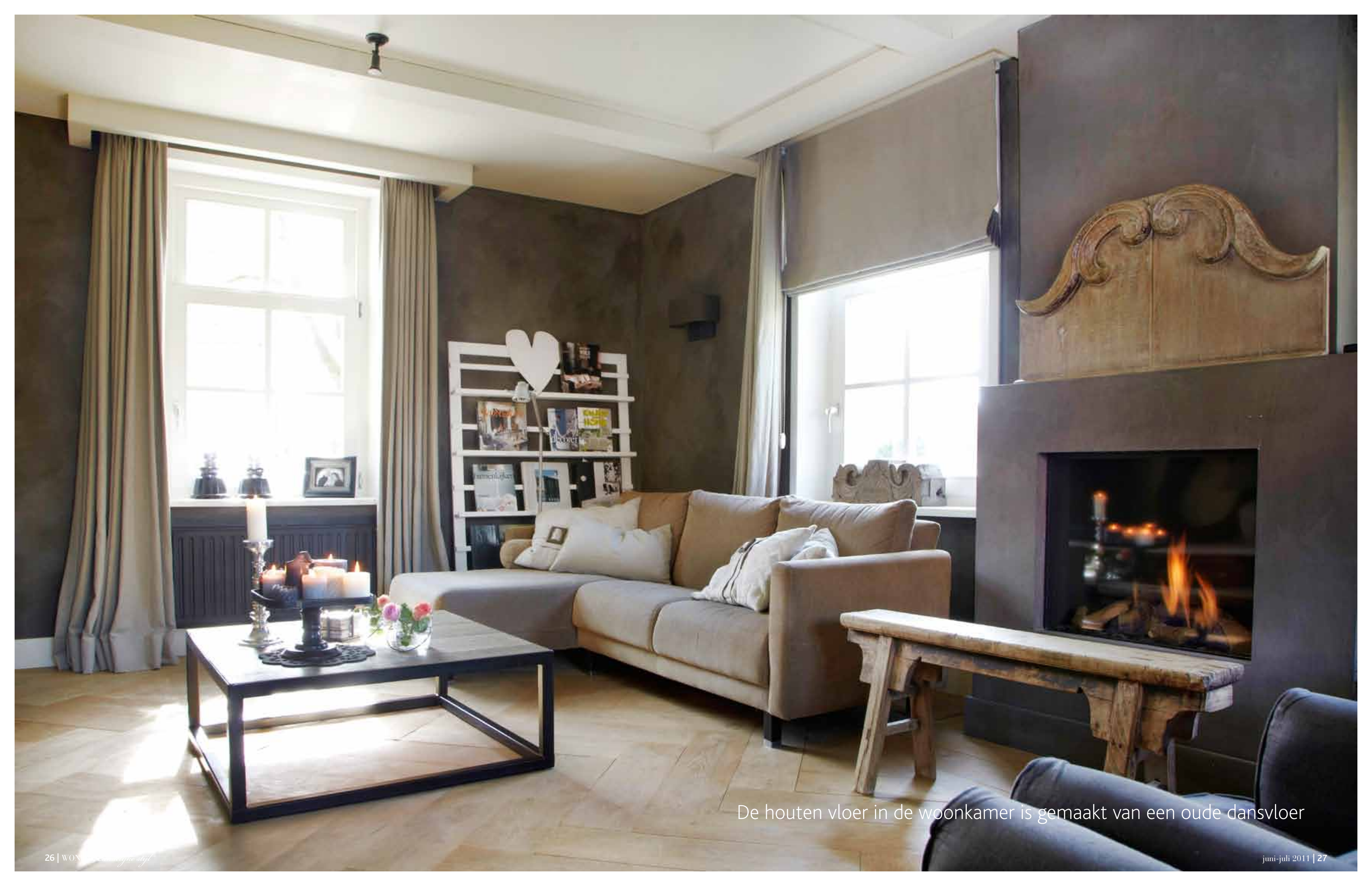
De houten vloer in de woonkamer is gemaakt van een oude dansvloer